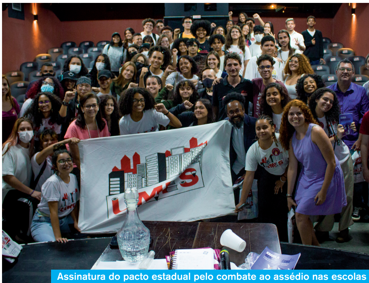
Assinatura do pacto estadual pelo combate ao assédio nas escolas