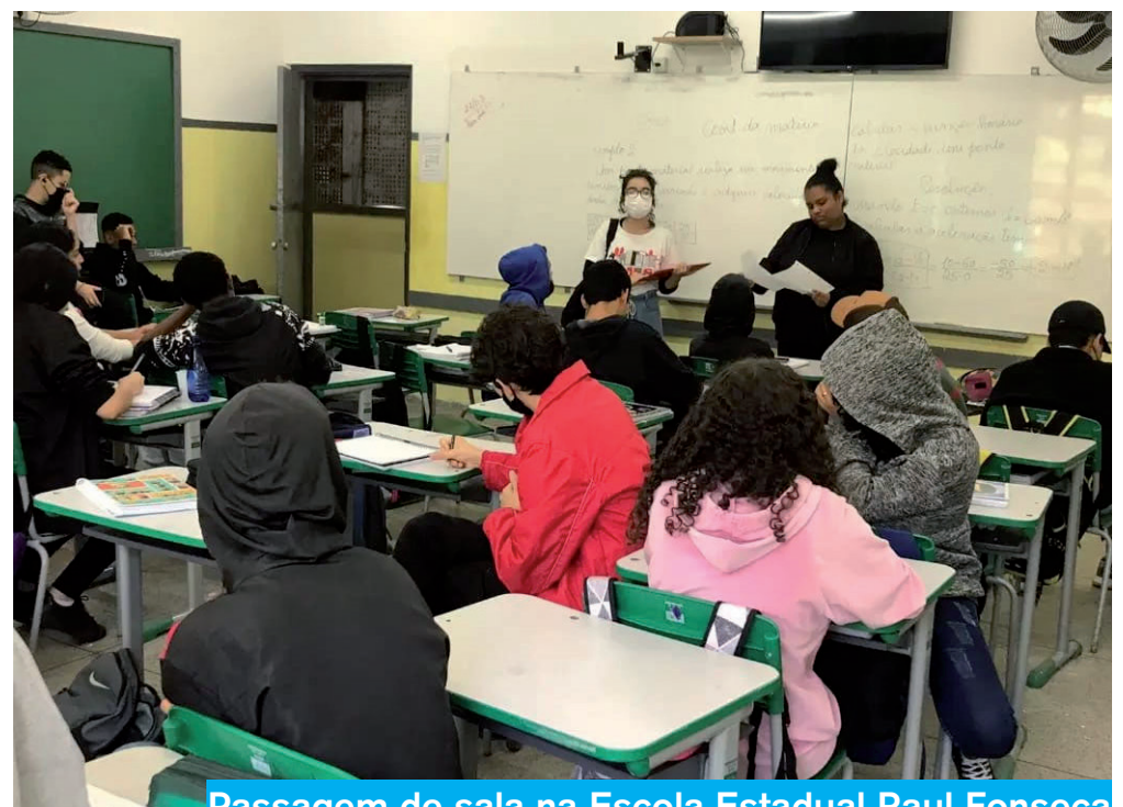
Passagem de sala na Escola Estadual Raul Fonseca