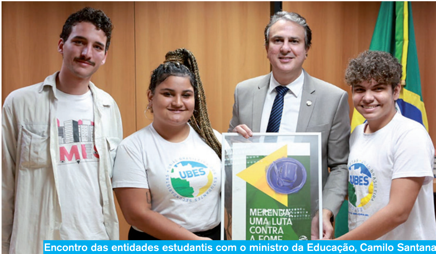
Encontro das entidades estudantis com o ministro da Educação, Camilo Santana

“Após quatro anos de desgoverno Bolsonaro, a gente entrou pela porta da frente do MEC”, destacou o presidente da UMES, Lucca Gidra