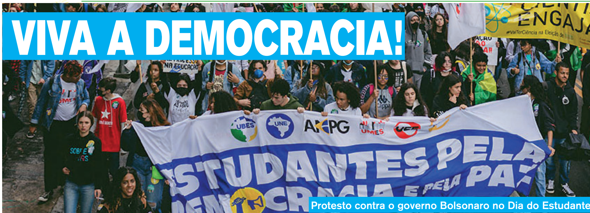
Protesto contra o governo Bolsonaro no Dia do Estudante