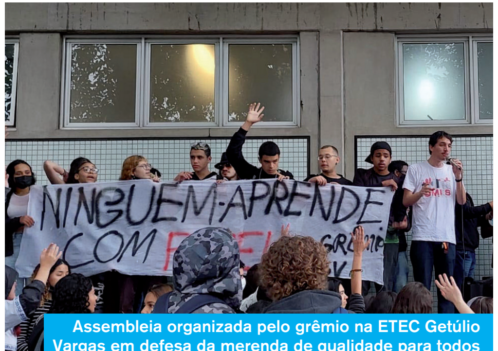
Assembleia organizada pelo grêmios na ETEC Getúlio Vargas em defesa da merenda de qualidade para todos

Conte com a UMES para ajudá-los no processo de Grêmios e em suas lutas!!!